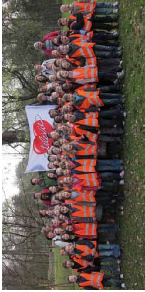
Marche parrainée organisée pour le Télévie par la section primaire du Collège du Sacré-Cœur de Ganshoren Marche parrainée organisée pour le Télévie par la section primaire du Collège du Sacré-Cœur de Ganshoren