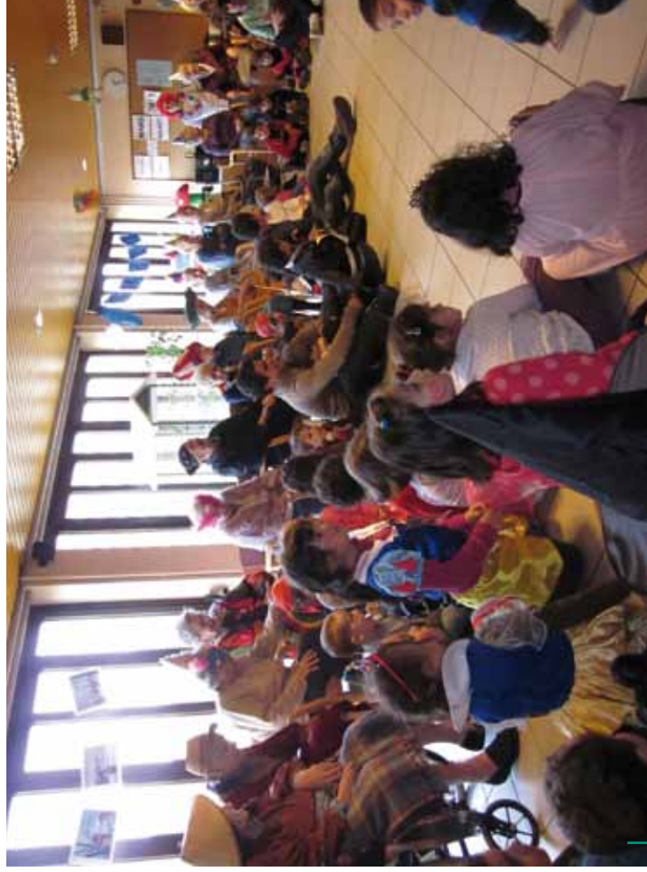
Rencontre avec les pensionnaires du home Rencontre avec les pensionnaires du home