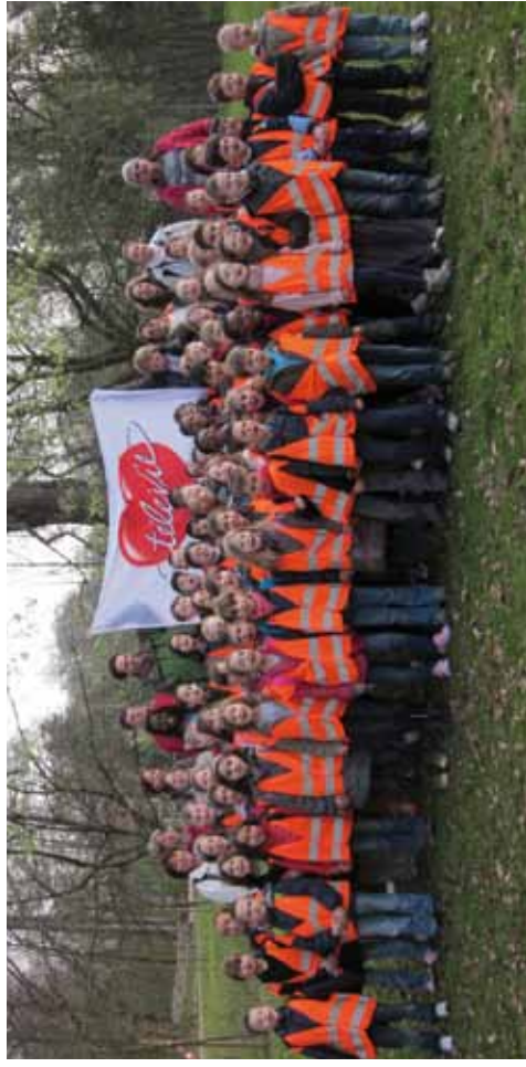
Marche parrainée organisée pour le Télévie par la section primaire du Collège du Sacré-Cœur de Ganshoren Marche parrainée organisée pour le Télévie par la section primaire du Collège du Sacré-Cœur de Ganshoren