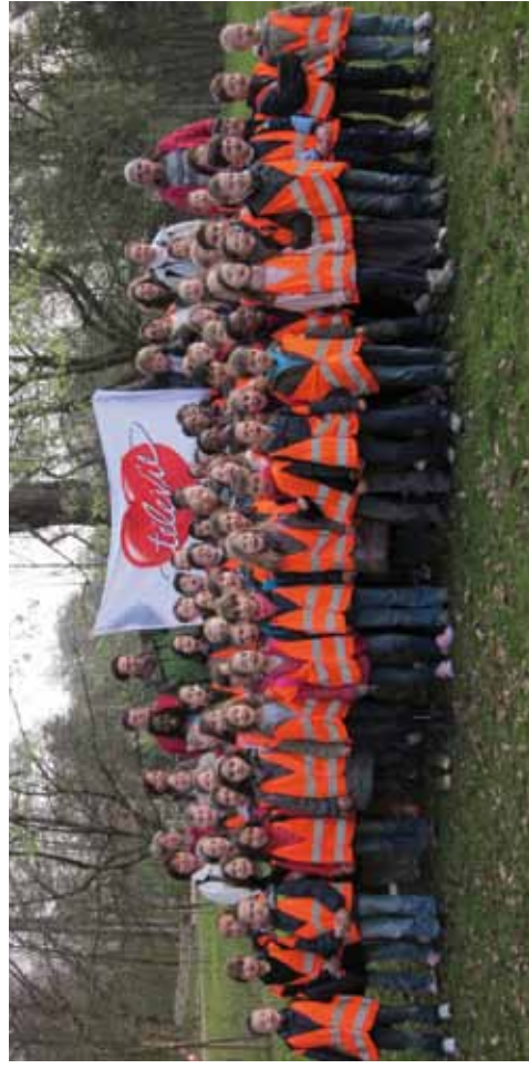
Marche parrainée organisée pour le Télévie par la section primaire du Collège du Sacré-Cœur de Ganshoren Marche parrainée organisée pour le Télévie par la section primaire du Collège du Sacré-Cœur de Ganshoren