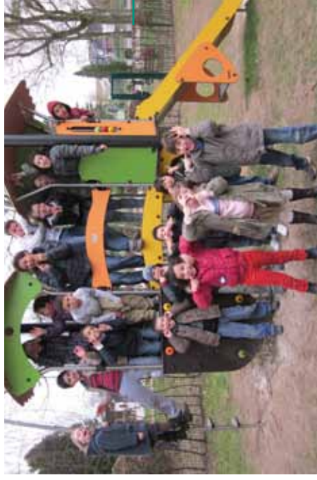
Plaines de vacances de Carnaval