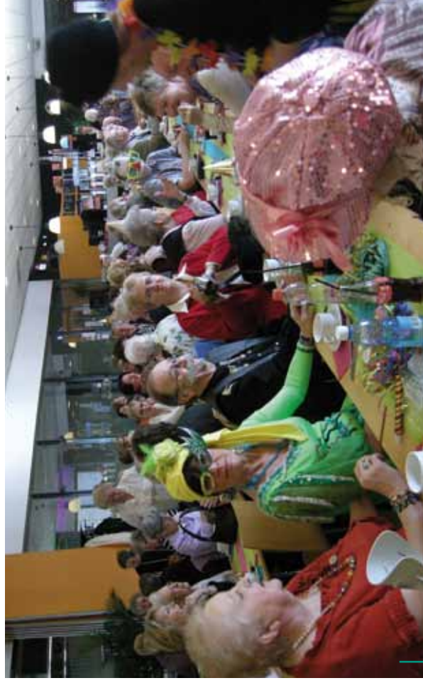
Ambiance de folie au Carnaval des Seniors 2011 ! Ambiance de folie au Carnaval des Seniors 2011 !