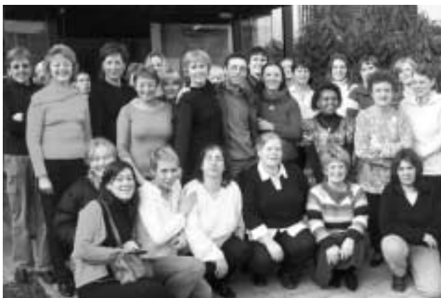
L'équipe des aides familiales et ménagères.

Une équipe d'aides familiales et ménagères est disponible pour venir en aide aux personnes en difficulté. Ce service, qui bénéficie de subsides régionaux, s'adresse essentiellement aux familles, aux personnes malades (post-opératoire), handicapées ou âgées éprouvant des difficultés à assumer seules des tâches de la vie quotidienne.