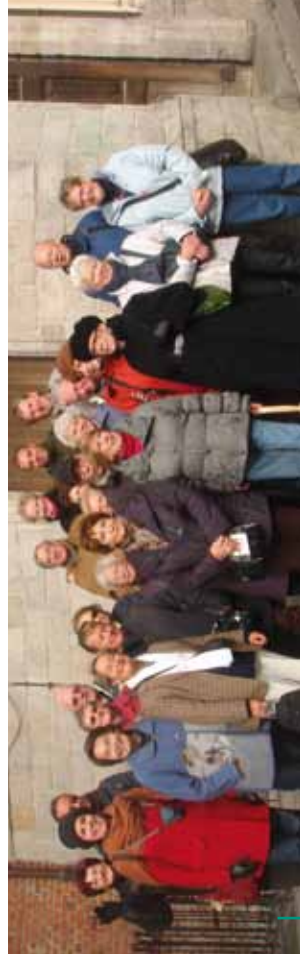
Excursion à Lille, la « Capitale des Flandres » Daguitstap in Lille, « Hoofdstad van Vlaanderen »