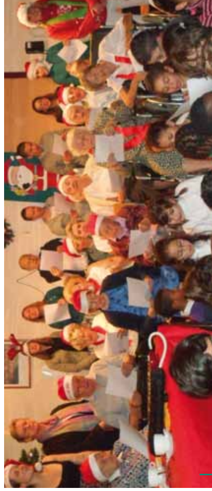
Goûter de Noël des enfants de l'école des devoirs accompagné des résidents du Home du CPAS de Ganshoren Kerstvieruurtje met de kinderen van de huistakenschool samen met de bewoners van het rusthuis van het OCMW van Ganshoren