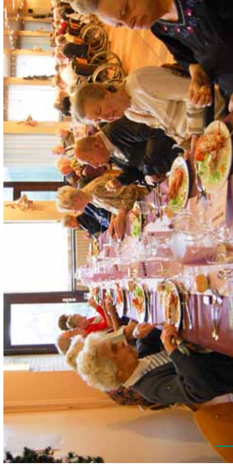
Banquet de fin d'année pour les pensionnaires de la maison de repos Eindejaarsbanket voor de bewoners van het rusthuis