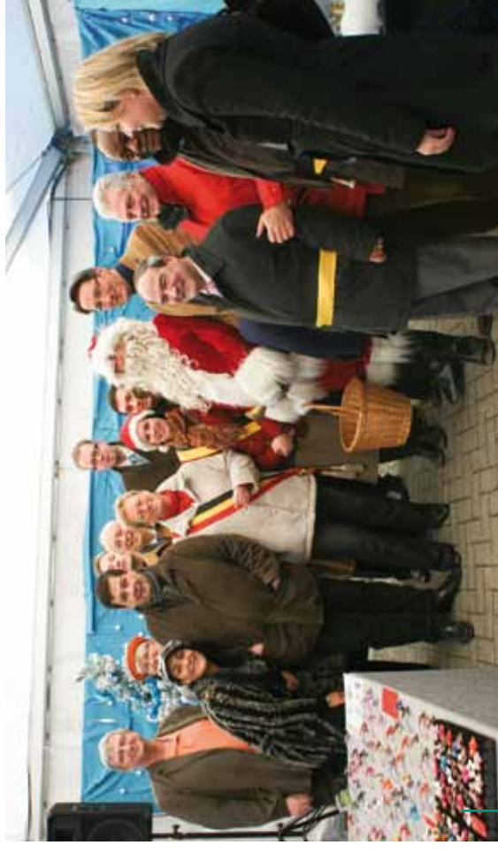
Bonne ambiance au marché de Noël 2011... Goed sfeer op de Kerstmarkt 2011...